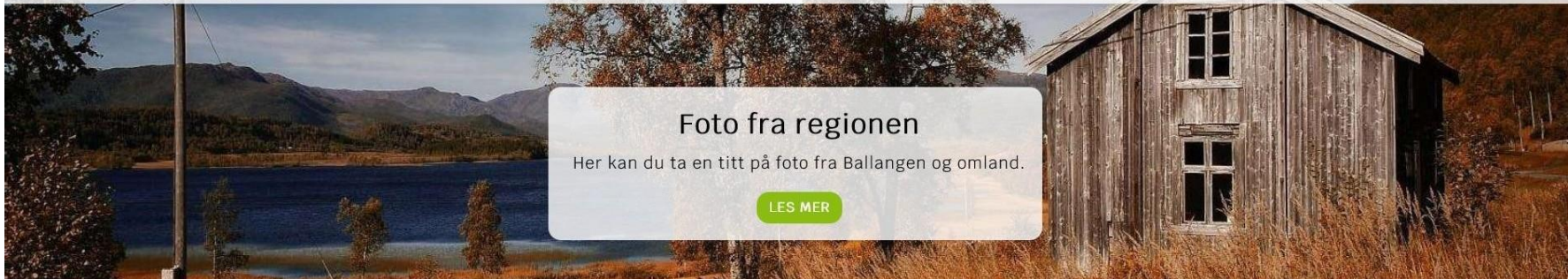
Foto fra regionen

Her kan du ta en titt på foto fra Ballangen og omland.